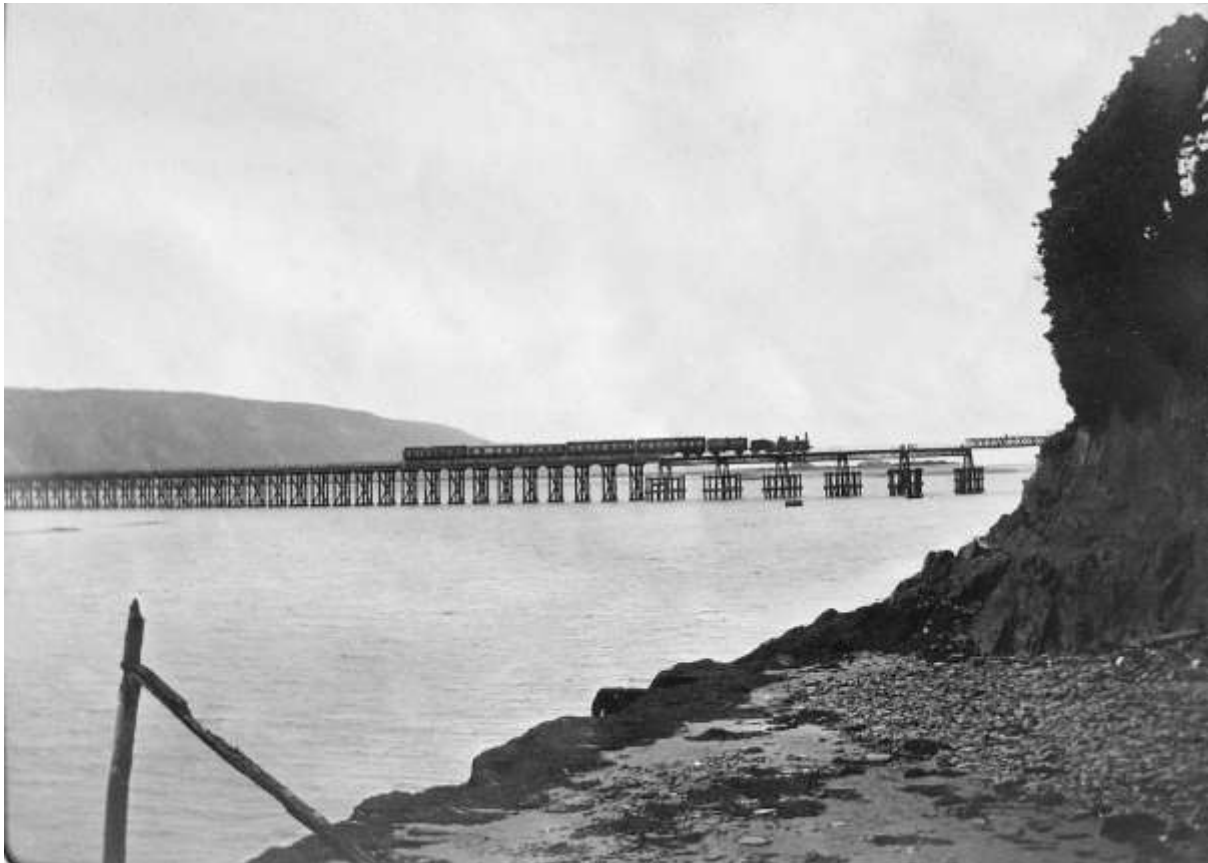
Pont yn 1889

Ym 1980 darganfuwyd fod mwydod Teredo wedi turio i bren y bont, a bod y tyllau a grëwyd ganddynt yn fawr ac angen eu trwsio. Byddai'r prosiect hwn yn cymryd pum mlynedd a hanner ac atalwyd pob trên rhag croesi'r bont am y cyfnod hwn. Ailagorodd y bont i drenau ym mis Ebrill 1986 ac yna ym 1987 agorwyd y bont siglo rhychwant dur am y tro olaf. Mae Pont y Bermo yn dal i fod yn un o draphontydd pren hiraf Prydain.