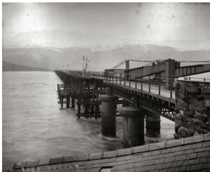
Cock and Draw 1880