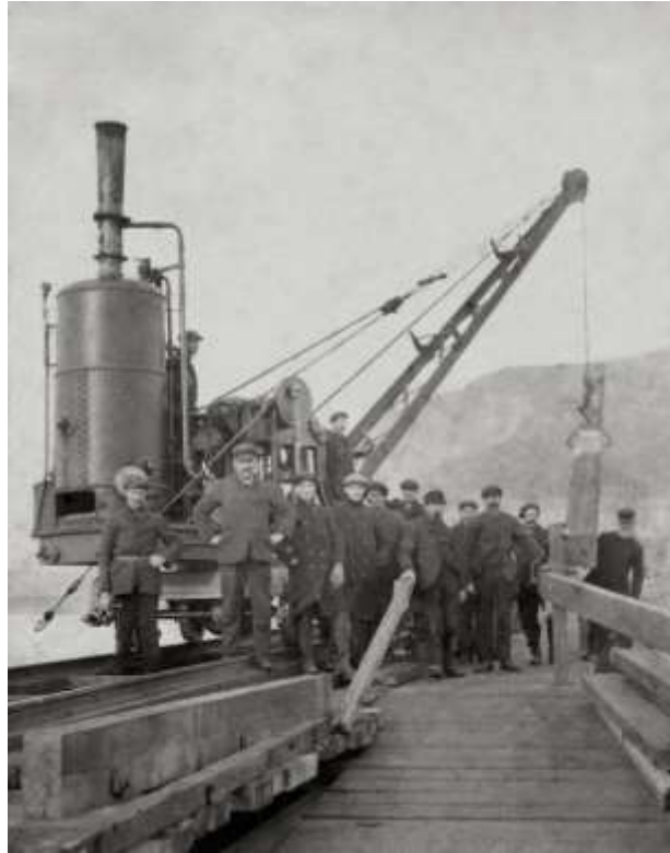
Adeiladu'r draphont 1866

Dechreuwyd adeiladu Pont y Bermo ym 1864 a chafodd ei chwblhau ym 1867 gan agor ar Mehefin 3ydd y flwyddyn honno i gerbydau ceffyl ac ar Hydref 10fed i locomotifau. Fe'i cynlluniwyd ac adeiladwyd ar gyfer Rheilffordd Aberystwyth ac Arfordir Cymru i greu lein o Aberystwyth i Bwllheli. Adeiladwyd y bont yn wreiddiol gyda 113 o rychwantau pren ac 8 rychwant haearn. Roedd adran "cock and draw" yn agos i ochr y Bermo. Pwrpas y rhan hon oedd i'r bont godi i adael llongau fynd i mewn ac allan o'r aber. Y gŵr doeth y tu cefn i'r bont oedd Thomas Savin, entrepreneur Cymreig. Roedd y gwaith adeiladu yn anodd oherwydd cerrynt cryf y Fawddach ac fe foddwyd dau ddyn yn ystod y gwaith adeiladu.