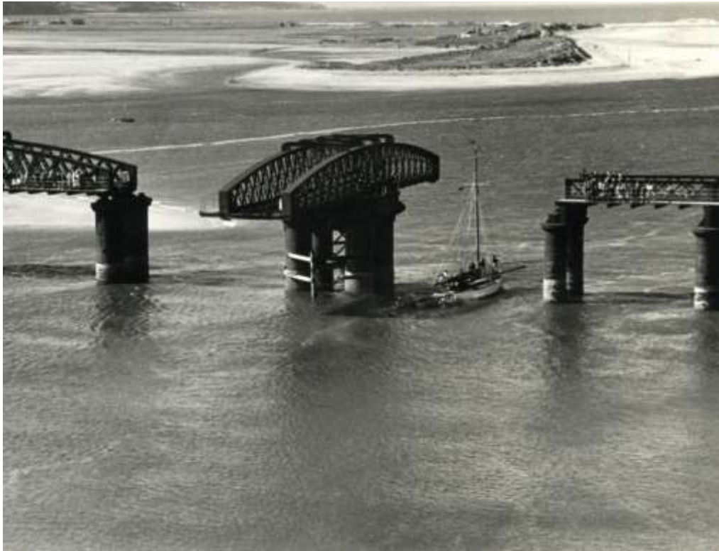
Rychwant Agored 1957

Ar ôl darganfod bod y darnau haearn wedi cyrydu'n ddifrifol ym 1899, codwyd dau rychwant dur gydag un yn bont siglen fel bod llongau yn parhau i basio drwodd.